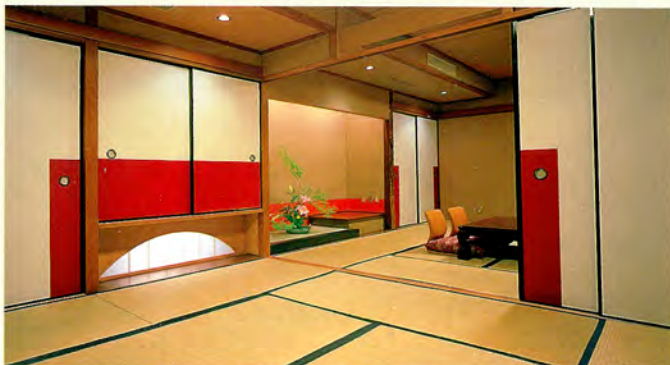
中広間タイプ(和室22畳) 25~35名可能