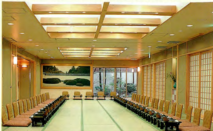
大広間(66畳・二分割可能) 80~100名可能