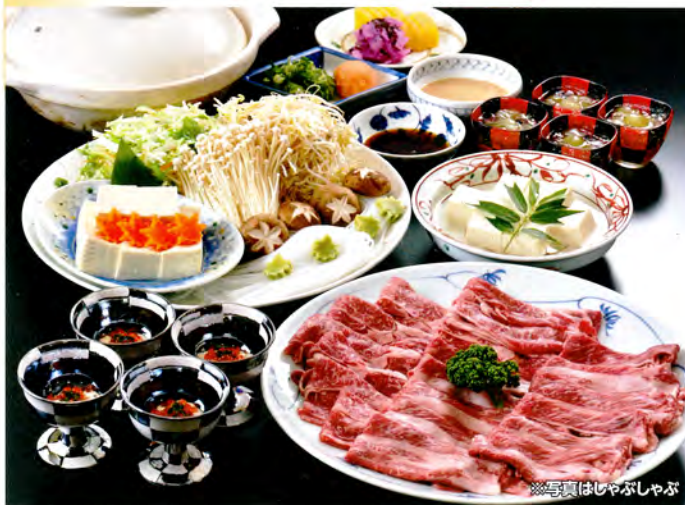
※写真はしゃぶしゃぶ

宴会開始から90分間お肉のみ食べ放題、すきやき (税・サ込) 4,500円 野菜等の追加は別途になります。 (持ち帰りはご遠慮くださいませ) しゃぶしゃぶ (税・サ込) 5,500円